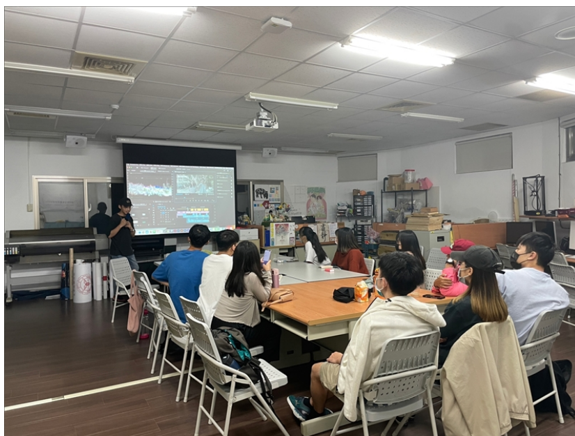
教授調色直方圖如何判斷

在下一堂課老師會提到說如何從自己喜歡的作品中找尋自己的創作靈感，更加期待下週的課程。