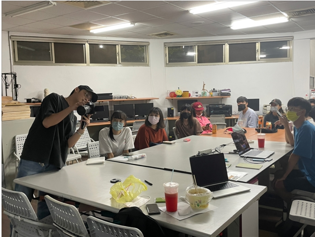
講解直方圖在相機上的顯示方式