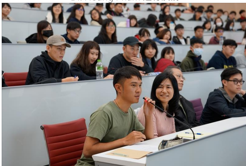
運輸科學碩士生提問