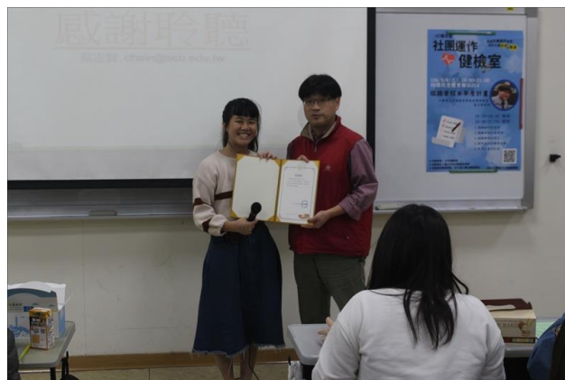
致贈感謝狀給講師