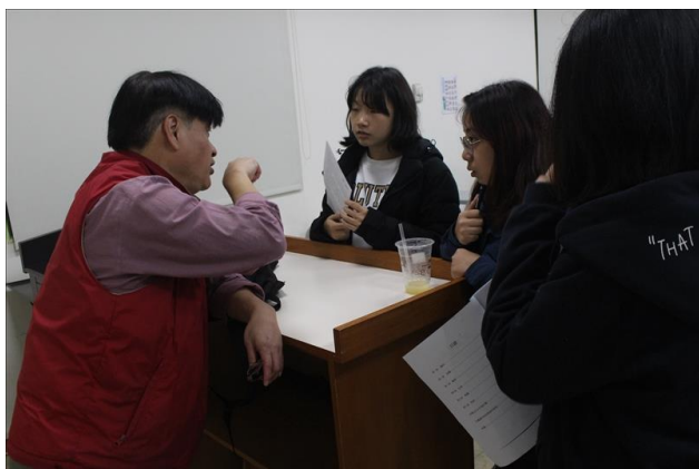
學生課後詢問老師問題