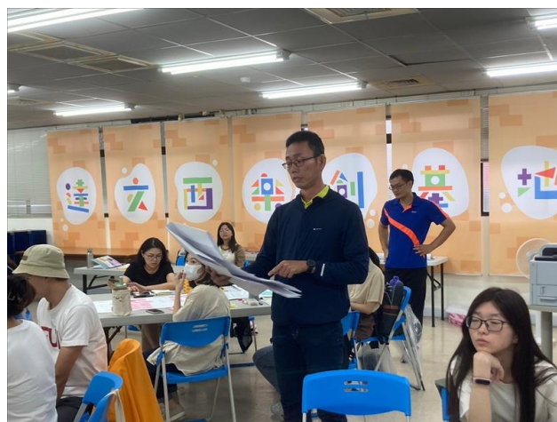
淡北計畫發表利害關係人 outcome

中長期效益評估不是一個百米競賽，而是希望長期透過各計畫端及校務端的努力來讓影響發揮到利害關係人身上，讓淡江大學成為一個重要的推手，持續落實環境、社會與經濟的永續發展。