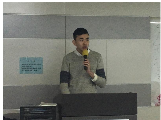
講師分享實際案例