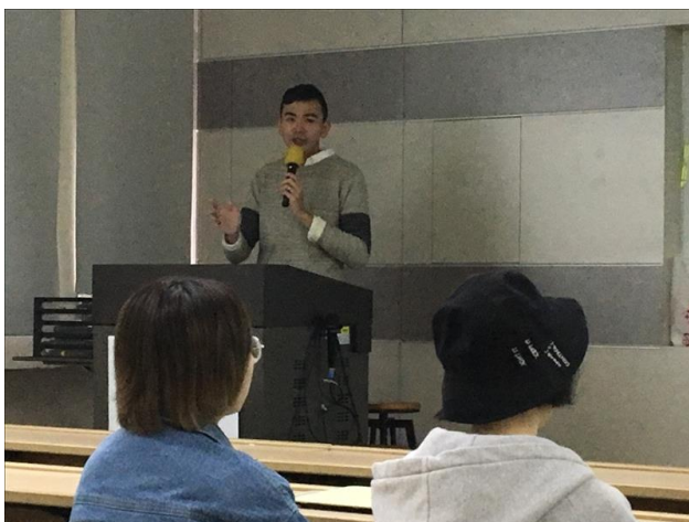
講師解答同學疑問