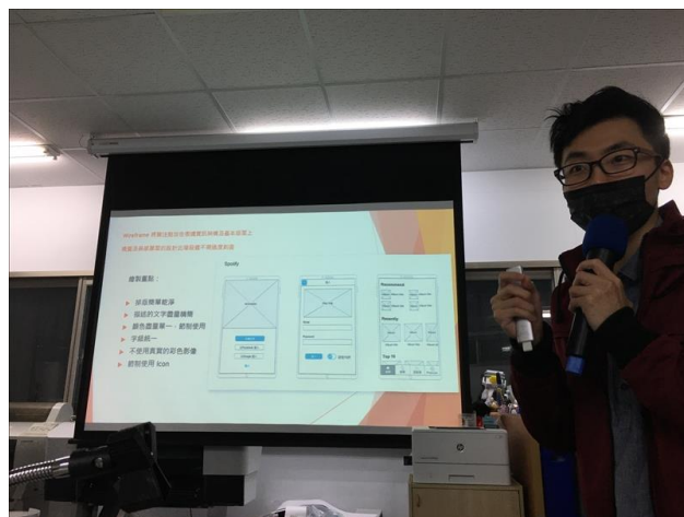
業師講解 Wireframe 的製作