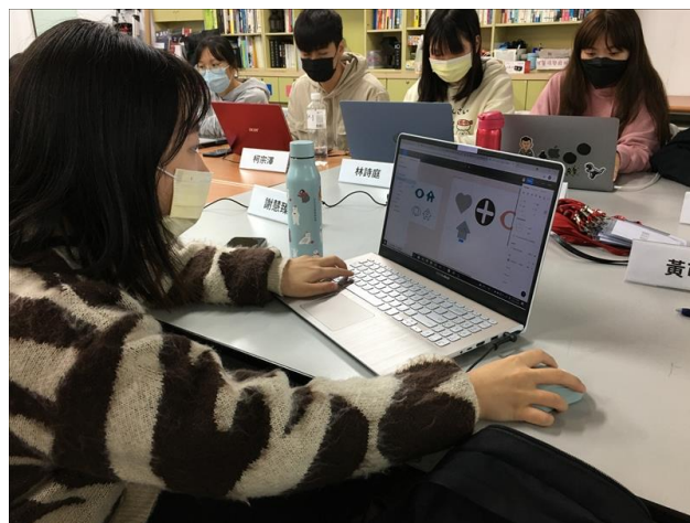
課堂 Figma 實作