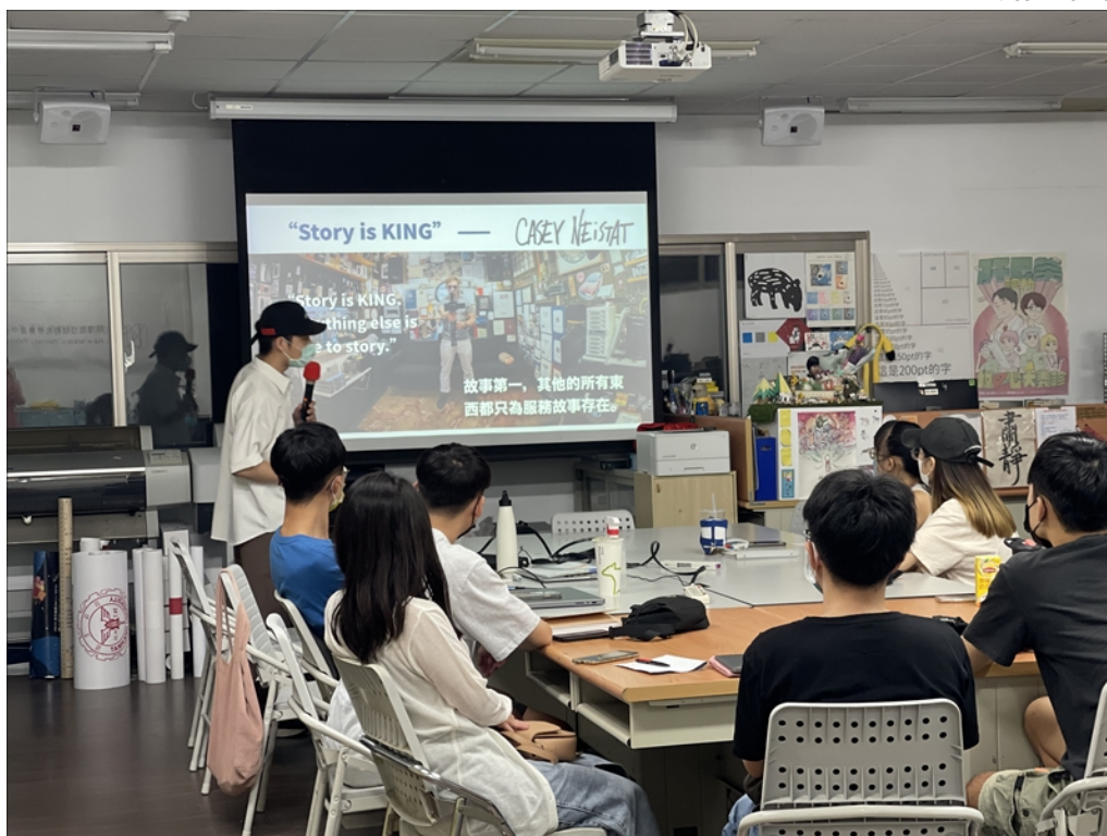
講解何謂「故事」以及「好的故事」需具備什麼條件