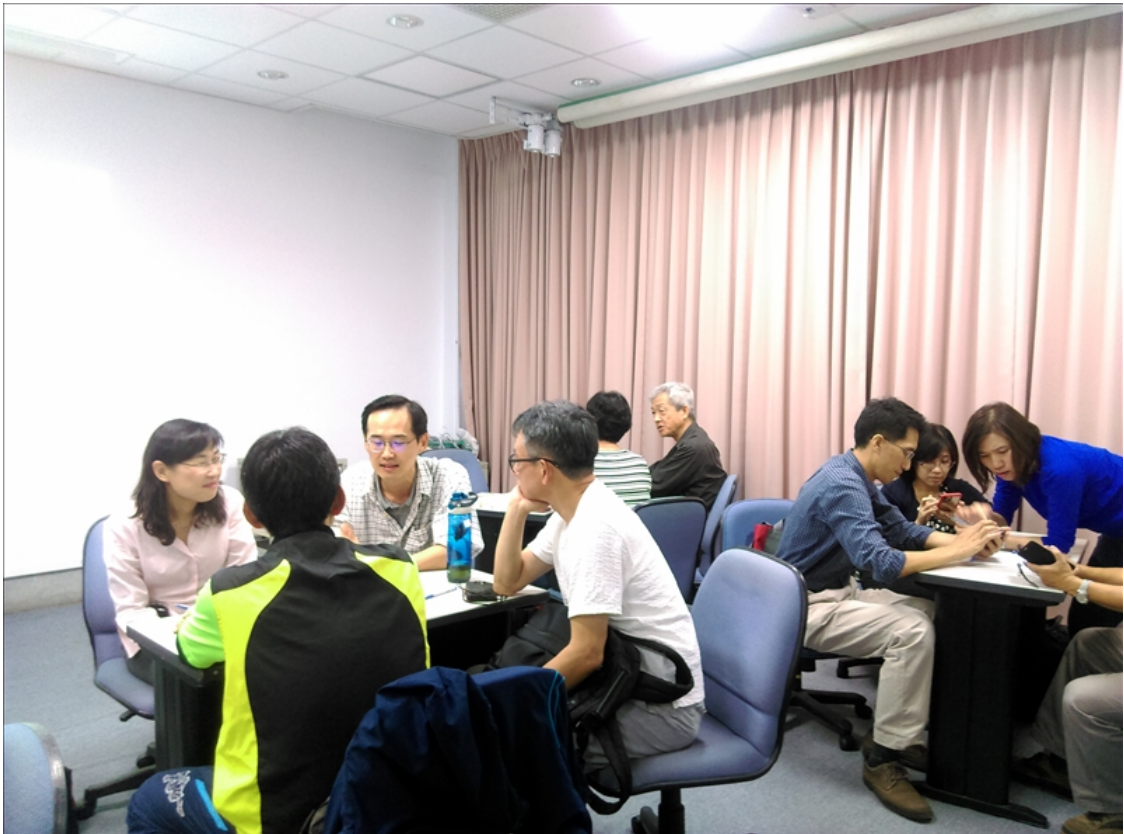
iClass 學習平台 PBL 應用入門工作坊(1016-2)