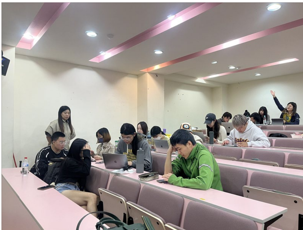
講師參與各組實作討論