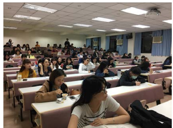
講者上課與同學聽講 02