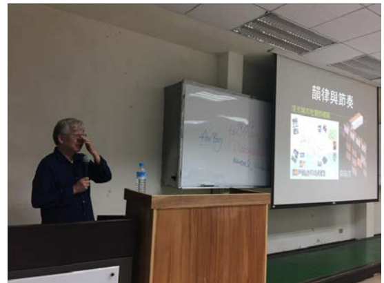
講者上課與同學聽講 01