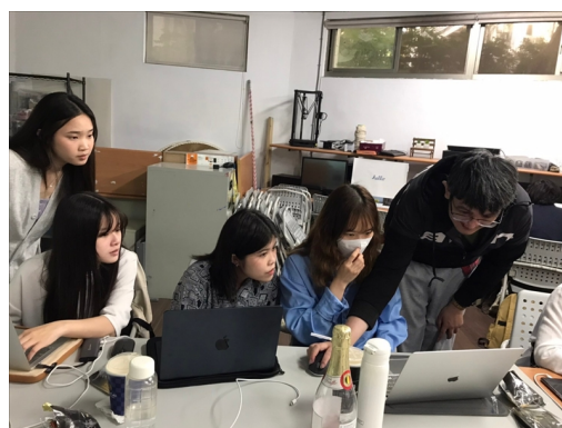
解答同學實作時遇到的問題