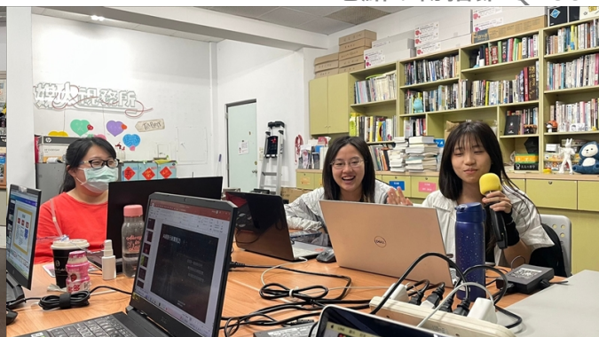
同學分享製作過程即遇到的困難