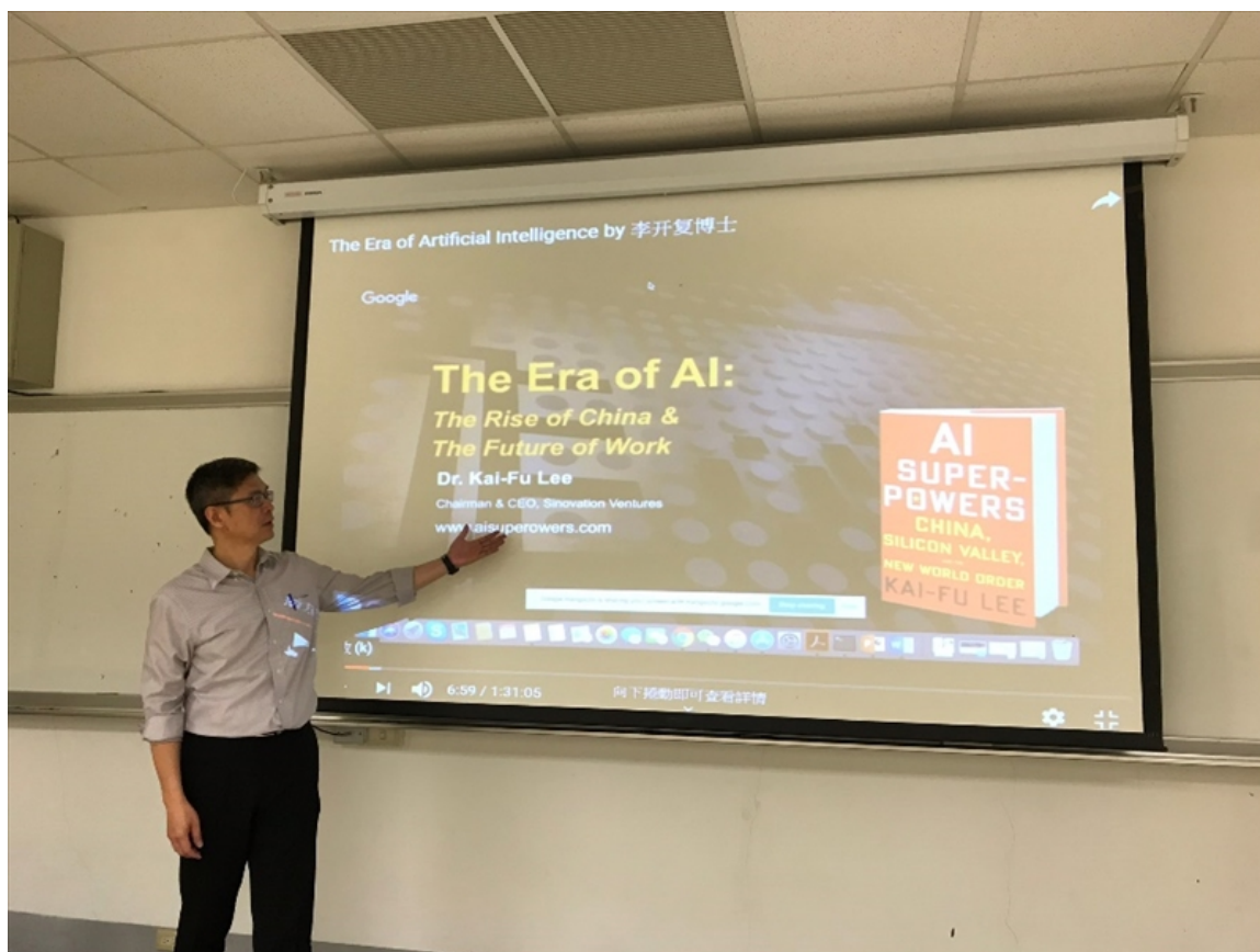
老師講解活動進行大綱