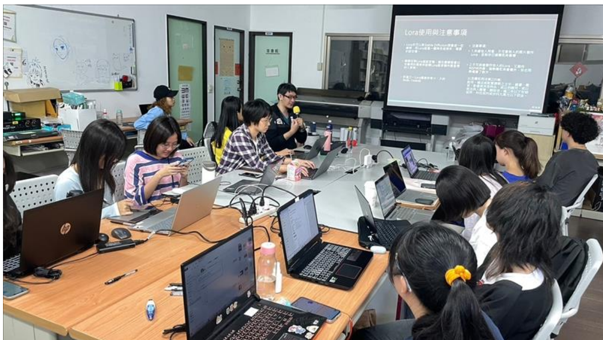
說明 AI 使用時的法律規範