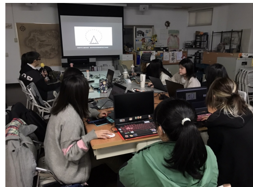
說明 AI 浪潮並不可怕，勉勵同學多多嘗試不要害怕被取代。