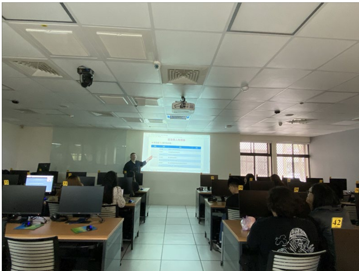
講解角色及功能說明