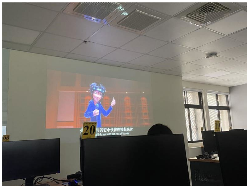
藉由大英雄天團電影來舉例說明