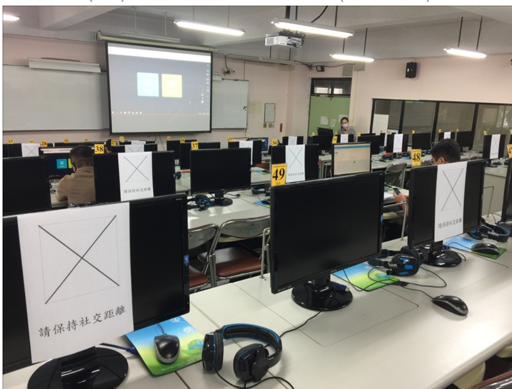
(211) 課程設計與課堂模式工作坊 (1101001-2)