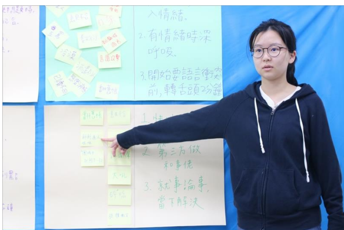
討論影響團隊合作因素