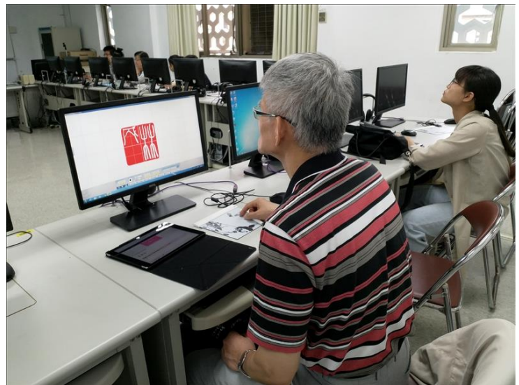
學員練習印章製作