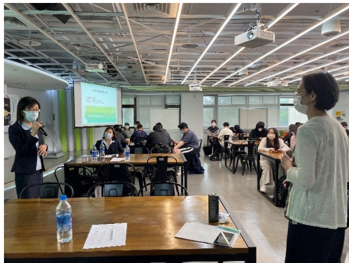
老師與講者資訊交流

託人也會定期給付費用給安養中心，而信託監察人亦即委託人的子女就扮演監督受託人的角色，使得三方皆信任且放心地完成信託服務。