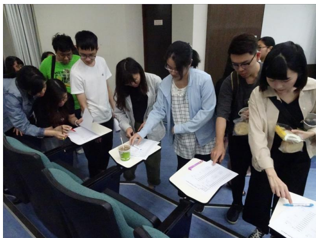
實習生簽到及索取資料