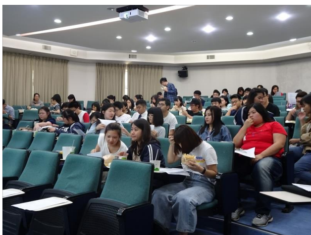
實習生專心聆聽說明會