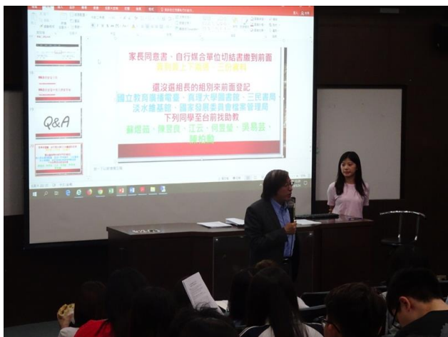
系主任到場勉勵實習生