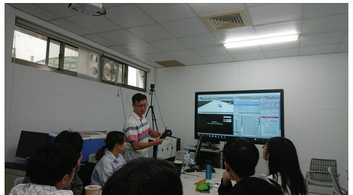
講師對 HTC VIVE 使用方式進行解說