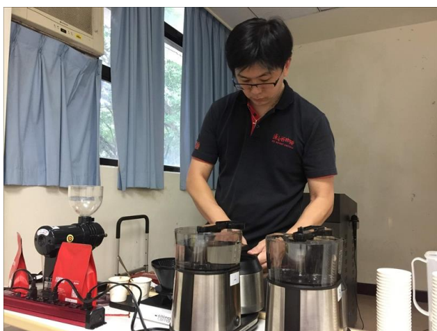
講師示範如何煮咖啡(1)