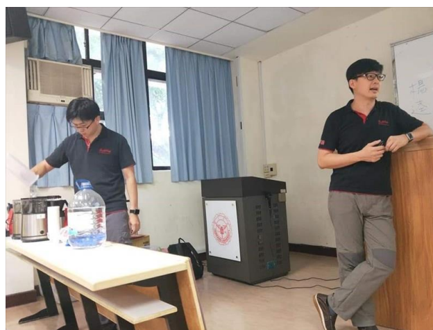
講師示範如何煮咖啡(2)