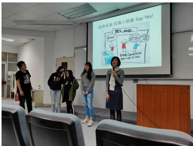
帶領學生一同完成創意發想遊戲

課程一開始講師先介紹自己是《藍色蜘蛛網》的編劇，用自嘲的語氣吸引學生的注意力，再介紹自己編寫作品時的心路歷程，並運用聯想創意等遊戲，帶領學生進行發想。最後，講師提供編劇提案的範本供學生參考，並說明提案時應準備的內容及隨時接受故事創作方面的提問。課堂間講師的溫柔與幽默，皆帶領學生一同完成一趟充滿想像力的短暫旅程。