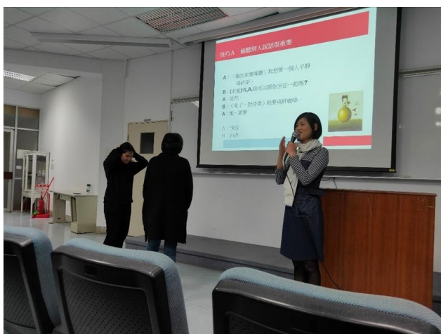
邀請學生上台並演繹 PTT 上的對話內容