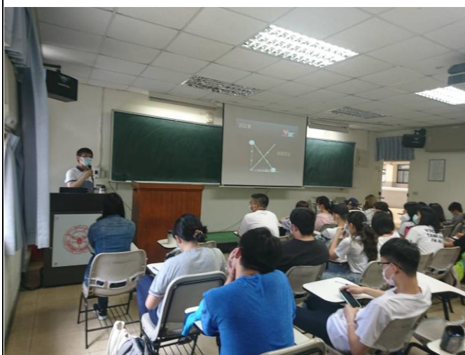
學生踴躍發言提問