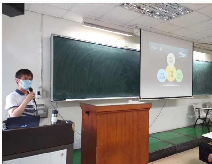
講師分享自身經歷