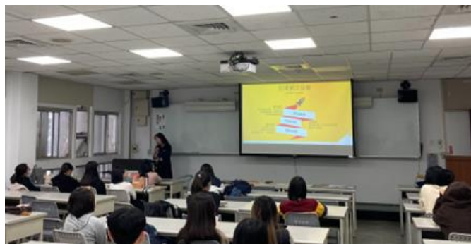
學生專注聆聽課程