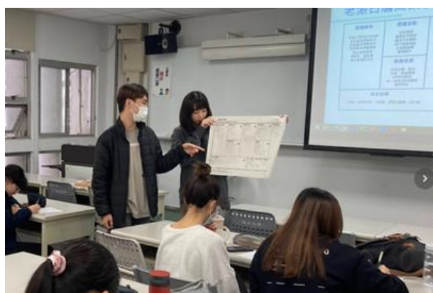
同學分享討論結果