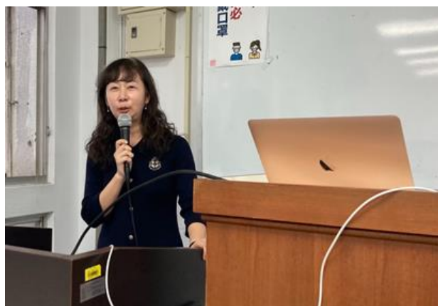
劉經理分享課程內容