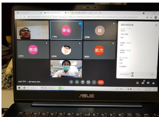
線上開場及介紹本次課程總單元及相關內容

本課程之最大不同就是教師本身以前擔任過資源教室輔導老師，本身幽默風趣，善於以學生同儕之間的語言進行課程，對於各類型身障生輔導有豐富的經驗。互動過中，固然某些學生較為內向，不擅於在大眾之間表達自己的意見，經過老師的誘導及示範，大多能夠跟上進度，並且充分表達自我意見。