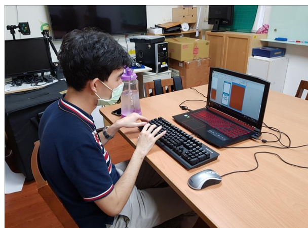
學生至資源教室遠距上課