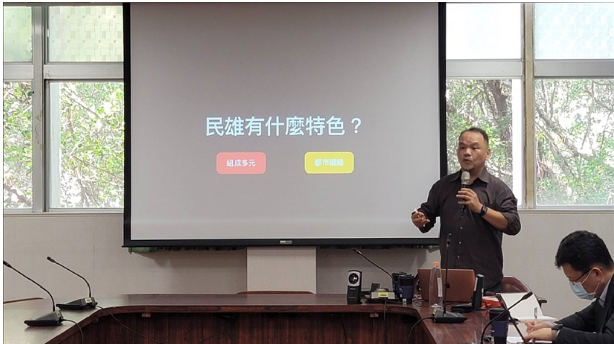
111 學年度文學院 「多元與創新」教學研習活動--我在「民雄學」學民雄