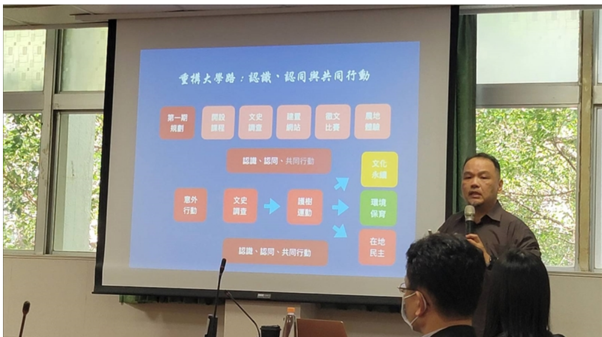
111 學年度文學院 「多元與創新」教學研習活動--我在「民雄學」學民雄