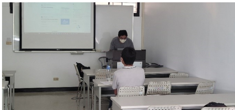
說明公有雲和私有雲的差異以及為何選公有雲