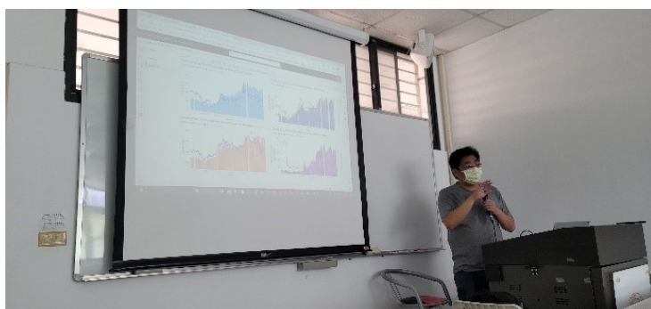
介紹 Power Vi – 資料可視覺化的利器