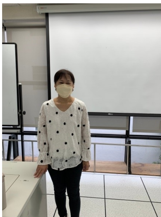
主持教師簡介演講者