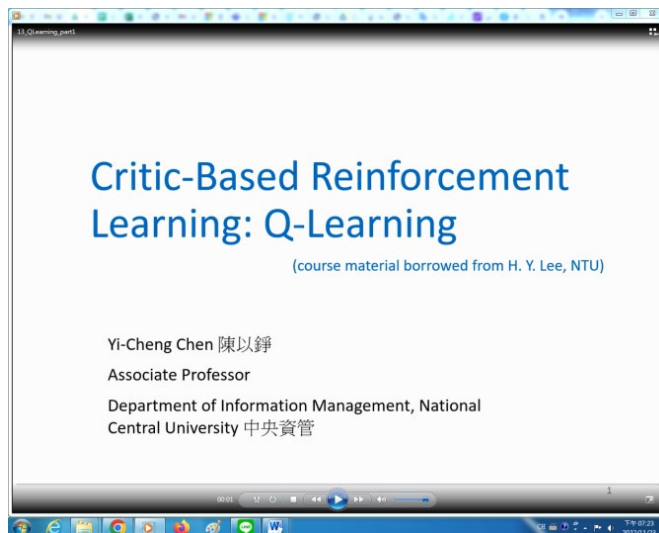
MS teams 直播影片