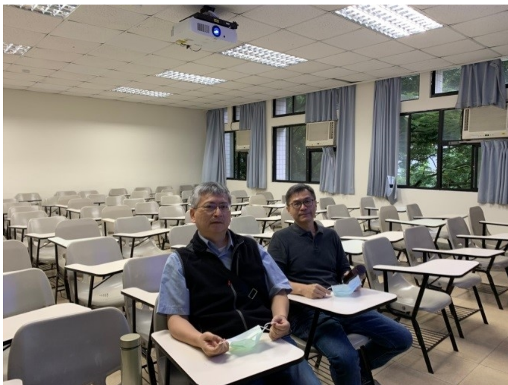
現場參與團隊成員