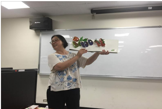
講者講解立體繪本(1)

第二本手工書，讓同學享用不同的表現手法，去體驗收集印章的樂趣，同學們彷彿回到孩童時間的歡樂！