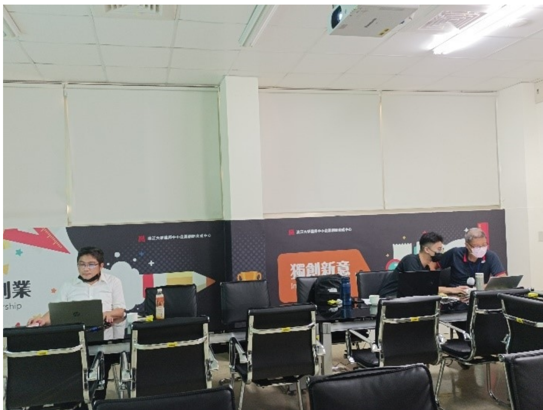
討論 Gabi 的優缺點