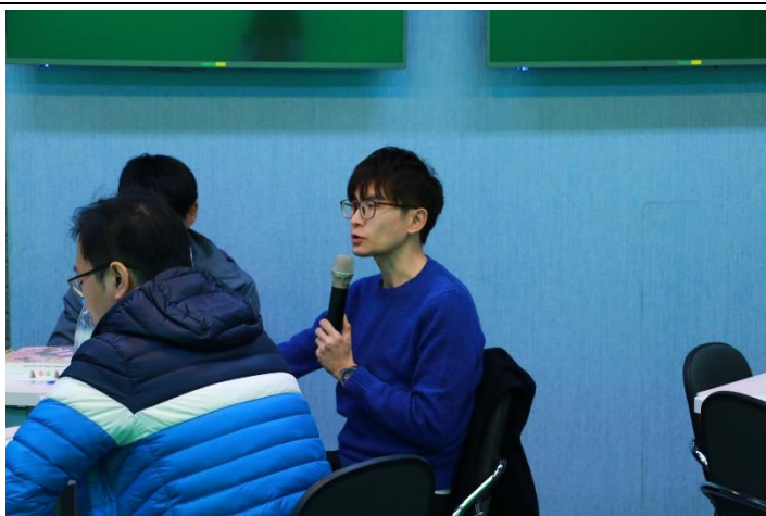
與會老師回饋與提問