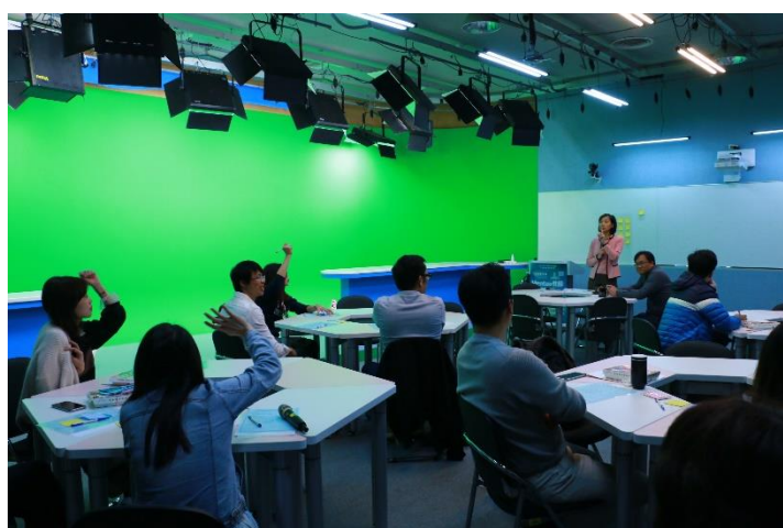
Q&A 時間李組長和與會老師互動