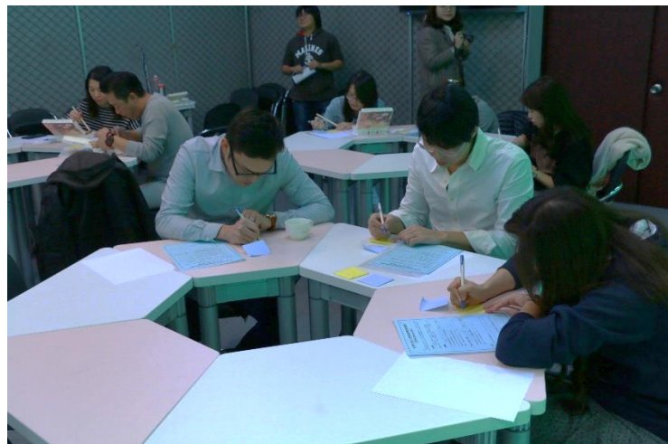
與會老師寫下這學期開心的事以及感到困擾的事