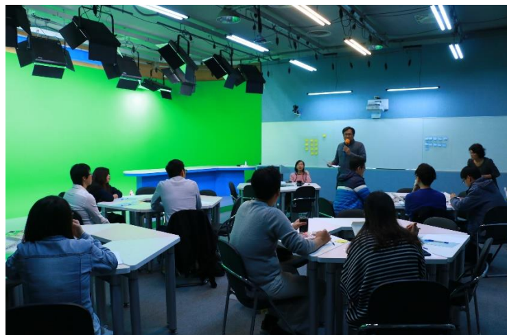
與會老師專注聆聽繆震宇教授分享