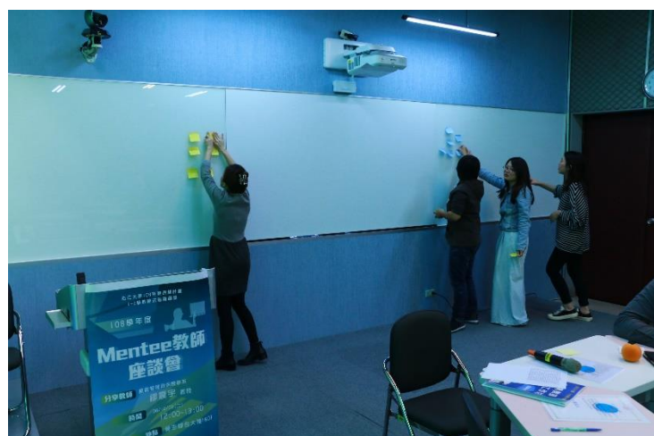
與會老師將開心的事以及感到困擾的事分享至白板