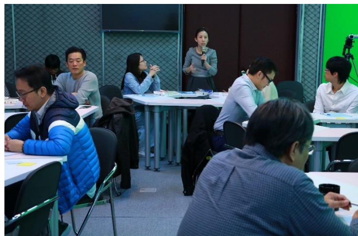
與會老師回饋與提問