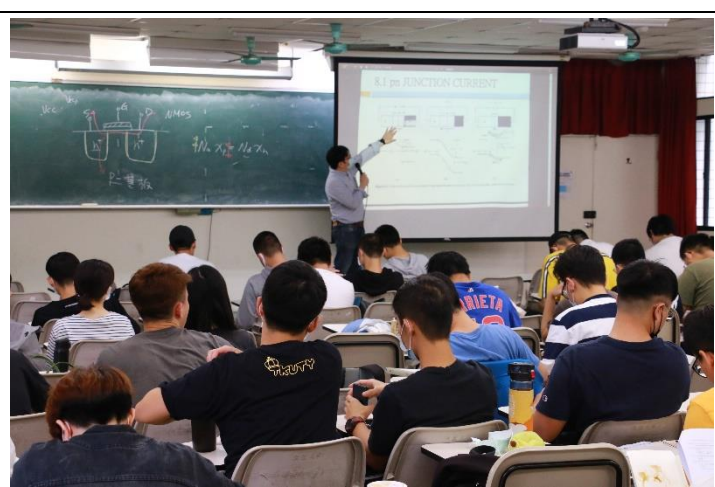
施老師透過圖文解釋，使艱澀內容較易清楚理解