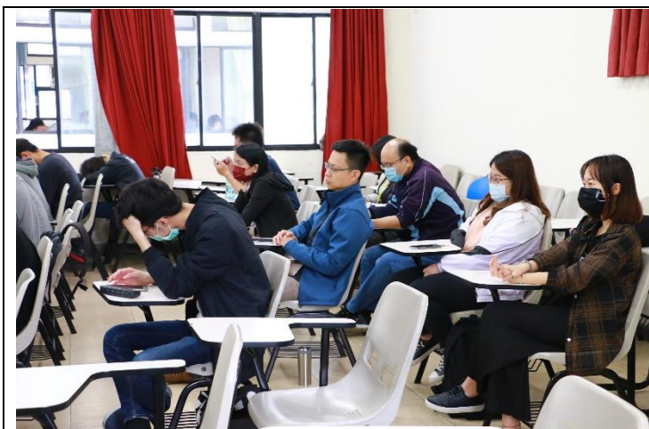
與會老師專注聆聽與觀摩課程