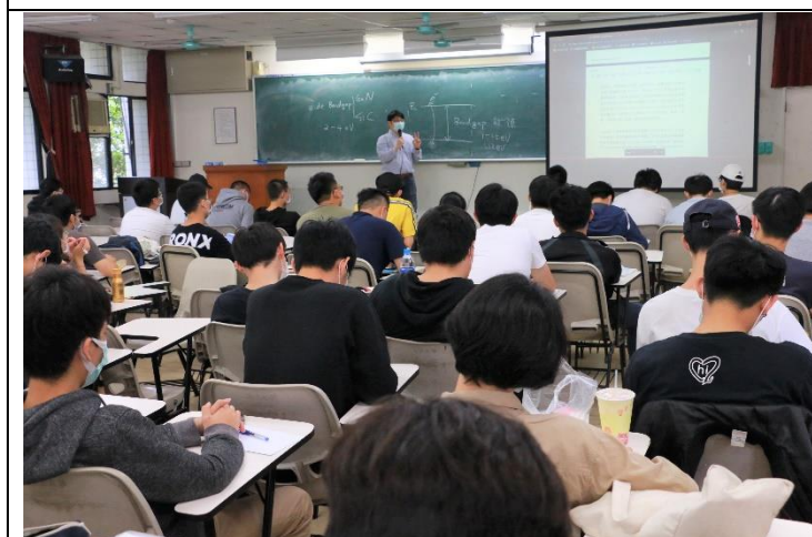
學生認真聆聽並抄寫筆記