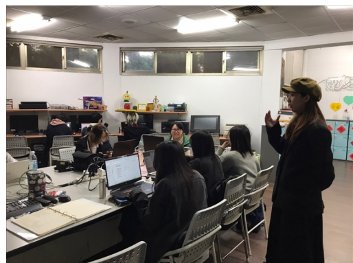
請同學發表假設的預算成本