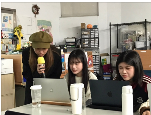
讓同學實際規劃專案脈絡

第三部分是預算成本的提點，從成本的基本概念、到拆解成本的種類、再到課堂上讓同學進行的實戰演練填報價單成本，這算是比較簡易的一個練習，大部分項目內容已經在上面，同學們只需要把空著的單價與成本查出來，並用最好的方式去評估。本次活動共 14 人參與。