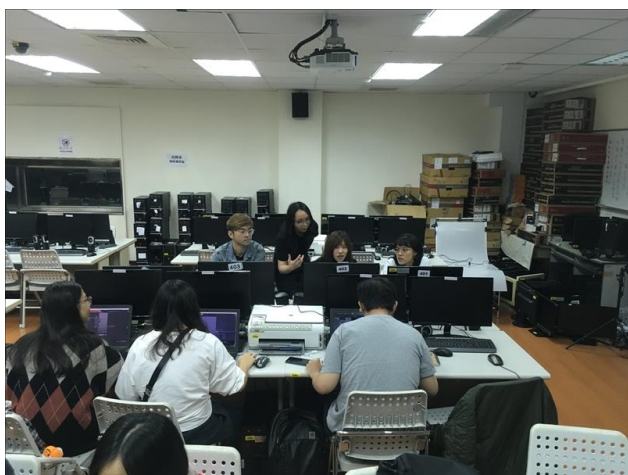
解除大家的疑難雜症