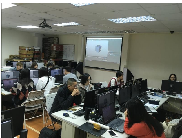
業師示範建模方式

除了基本操作，學姐介紹很多業界的 3D 大師，為的是給大家看一下 3D 的創作應用，可以在很多風格呈現，不只單一算圖或是產品動畫，主題性、故事性，都是創作的一環，這次分享 3D 的東西，即是讓大家能夠有這項技能，或是以這樣的想法、思維去製作自己的作品，再次強調 3D 是個工具，怎麼運用都決定在個人。