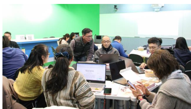
與會老師專注參與研習活動