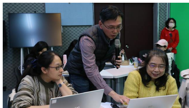
陳 老師引導與會老師進行 AI 工具應用實作