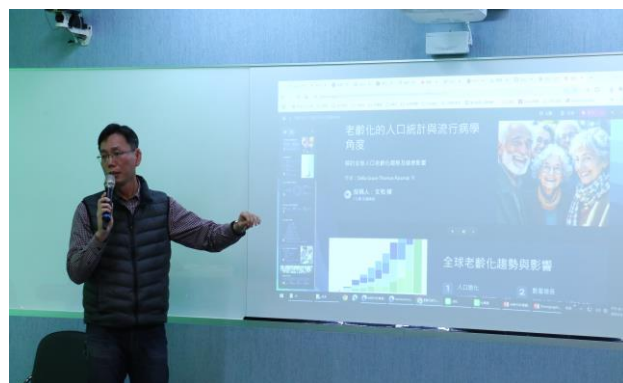
陳 老師分享 AI 教學簡報製作範例