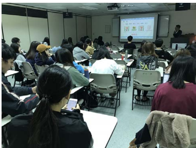
學生認真聽講，並記下上課內容