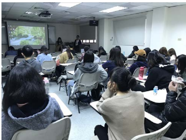
老師引言，介紹講者的背景

講者透過自己在統一 7-11 和黑貓宅急便的工作經歷，分析他曾經辦過的 7-11 集點活動發想和執行，其重點在於下列五點：1.降低風險，如利用規模經濟降低成本與利用招商贊助降低風險。2.保密原則，只有高階主管看過贈品，防堵競爭店。3.門市執行，全省說明會及內部執行手冊。4.科學分析，設定門檻以拉動消費者客單價。5.系統提示，建立收銀機系統提示幫助門市贈送贈品。以及利用黑貓宅急便的低溫配送來幫忙促銷高地水果的活動，讓同學們更了解專案執行時要注意的各種細節。