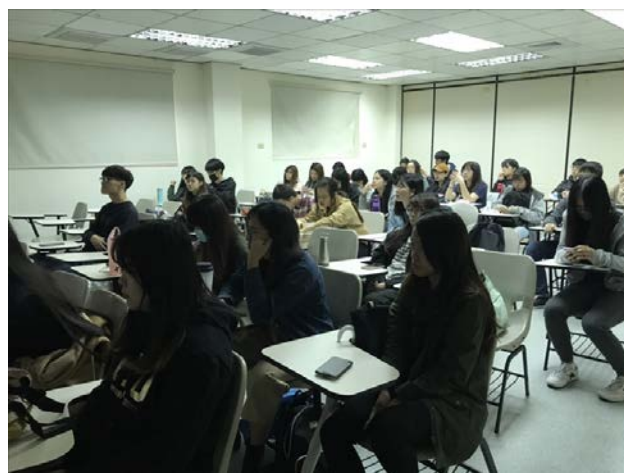
學生認真聽講，並記下上課內容