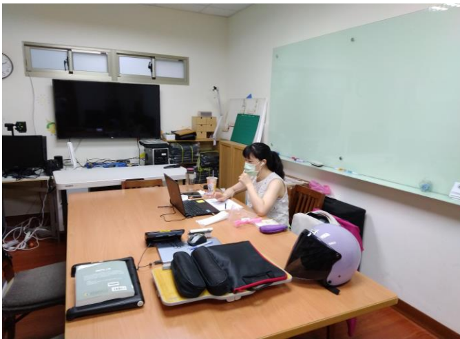
介紹本次課程總單元及相關內容 聊天與溝通有何不同?

在人際互動過程中，關係往往建立在彼此相互理解的基礎上，然而，對於如何理解他人及表達自己，進而讓溝通能夠更順暢、關係能夠更靠近，是每個人必要的學習，透過日常的對話及練習，更能掌握溝通的訣竅，讓自己成為溝通大師。