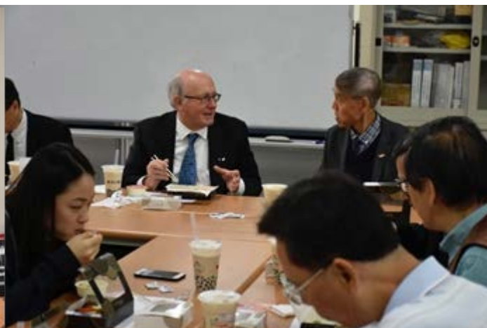
馮朝剛教授與講者交換意見