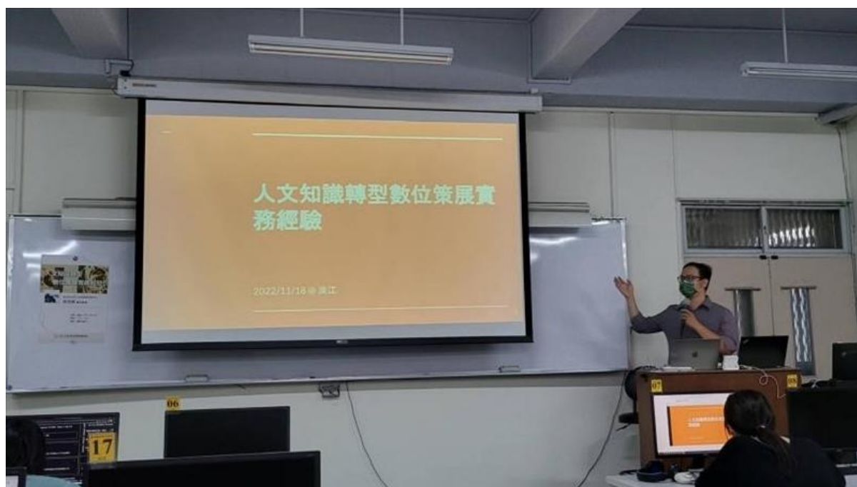
徐講師介紹本次講題 「人文知識轉型數位策展實務經驗」

最後，徐講師安排了數位典藏系統的 OmekaS 的線上操作活動，讓同學練習以實際的資料著錄到 OmekaS 系統上。儘管因為同學使用太過熱情造成系統當機，但用 OmekaS 數位典藏系統進行實機操作的過程讓許多同學大為讚賞。