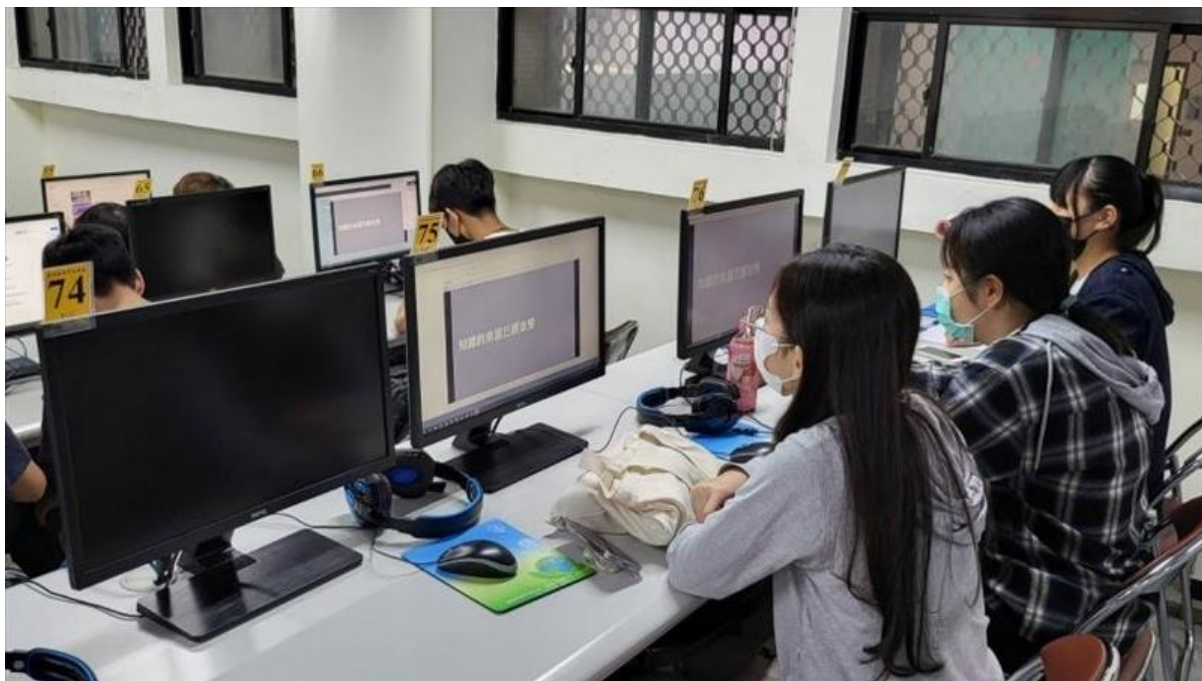
認真聽講的同學們