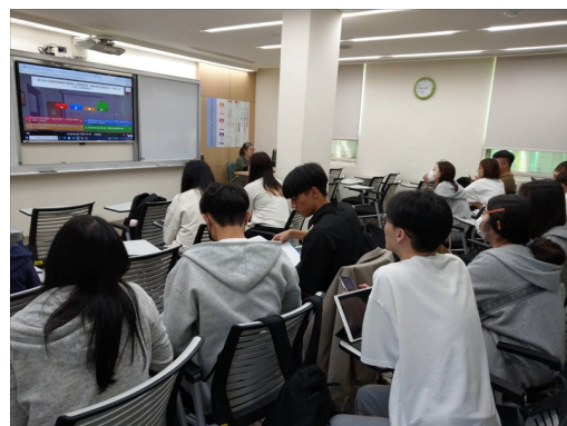
講師使用 Kahoot 出題檢視學習成果