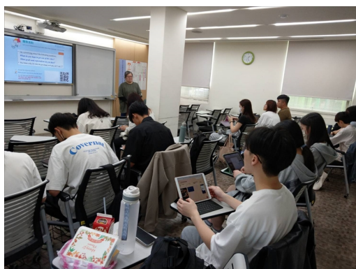
講師請大家寫下對這堂課的期望

講師首先提供 QR code，讓參與學生介紹自己，並以英文一句話表達這堂課想要學到什麼，再請學生掃描 QR code，寫三個不重複的青少年特質，並且展示大約 300 人次寫下的結果，以衝動、好奇心、重視同儕的最多，然後播放影片解說青春時期的大腦發育仍不成熟，並且進行同理心實驗，指出在英語教學上的應用，接著說明第二語言習得的五個發展階段，以及國中英語學習扶助的發展階段，並且舉出相對應的活動示例，最後使用 Kahoot 檢視今日所學。