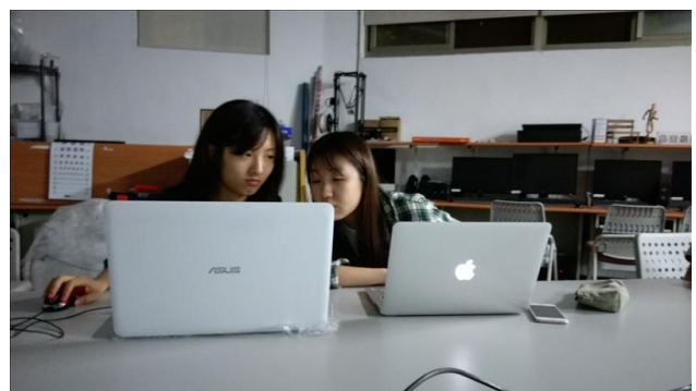
課堂的網站撰寫與學習討論