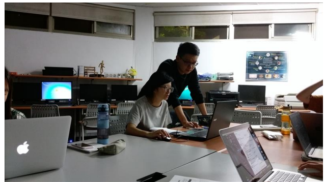
業師一對一地教學指導