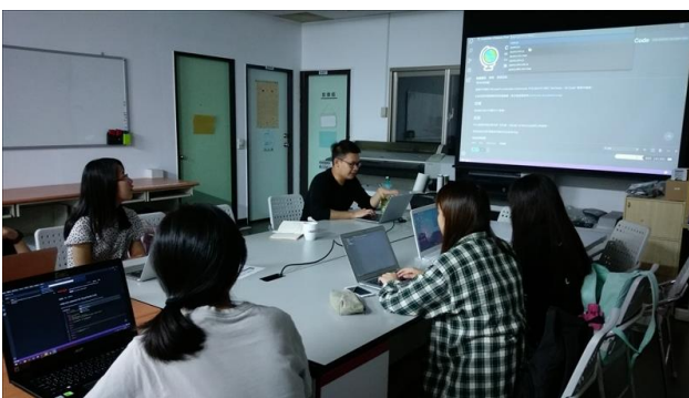
業師教導 Visual Studio Code 的外掛下載