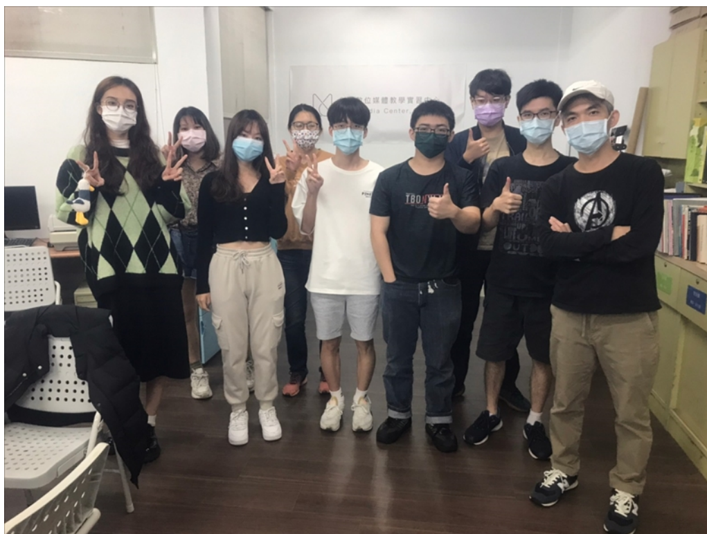
業師與組員的合照