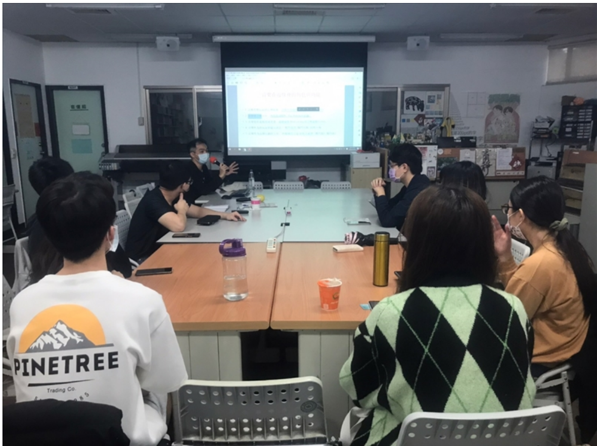
業師和組員講述內容

音樂與音效不是憑空誕生的，業師建議我們應多觀察參考不同類型的作品，其中的音樂音效是如何使用的，再回頭審視自己作品的製作方向，不用拘泥於特定製作方式，無論是素材修改使用亦或是直接錄製想要的音效，只要明確目標並願意學習與嘗試，就能打造出最適合作品的音樂與音效，本次活動共 9 名成員參與。