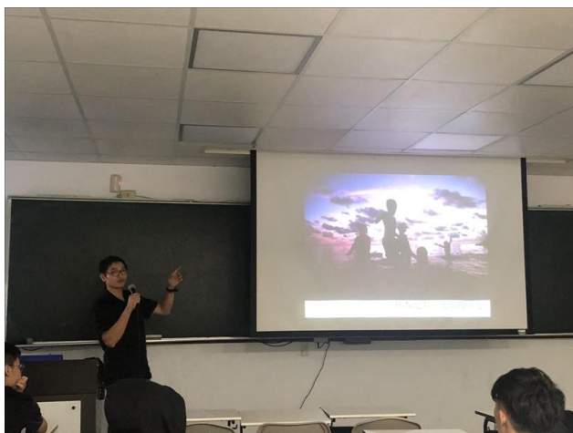
講師講解有關攝影的重要因素