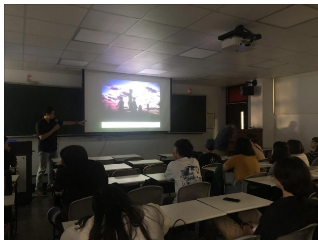
講師講解有關攝影的重要因素