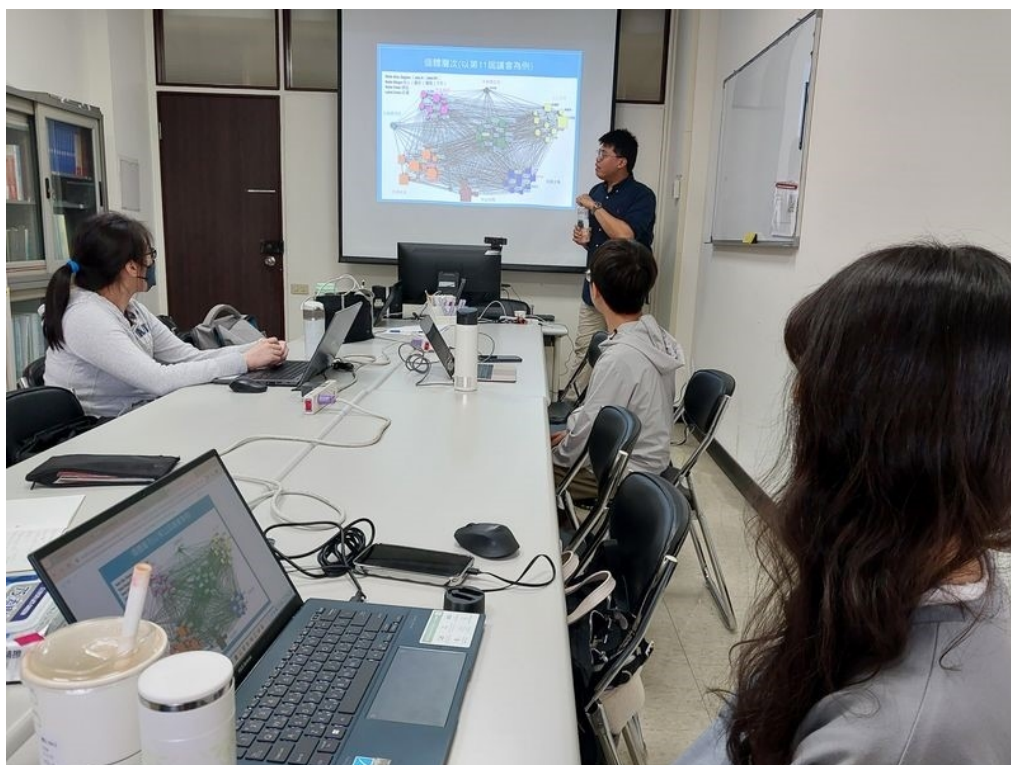
驚歎於社會網絡分析魅力的同學