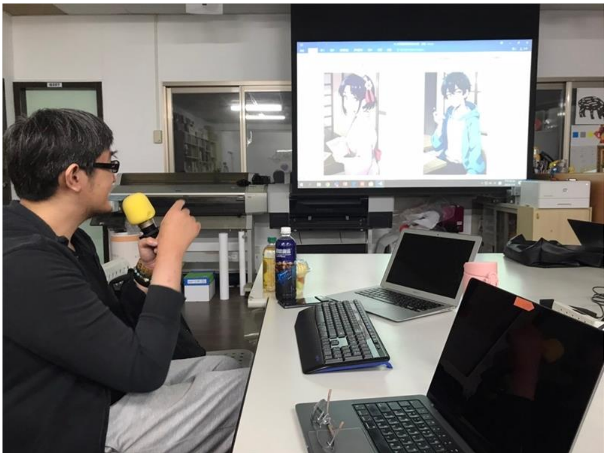
業師講評同學作業

接著也向大家介紹了如何使用 stable diffusion 來製作並且生成一個 Lora 的模型，較特別的是除了靠自己主動發想一些提示詞外，也可多加利用利用 flowgpt 這個語言生成式 AI，請它自動生成一張圖片的正面以及反面提示詞，只需將基本的需求寫出，他會自動生成更詳細的資訊如地點、場景等等，使同學們的圖片生成更佳의完整及方便應用。