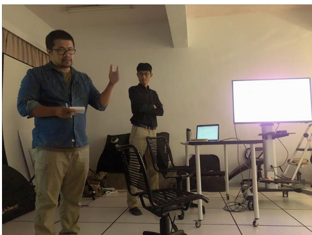
子正老師聽完講者的演講後分享自己的感想