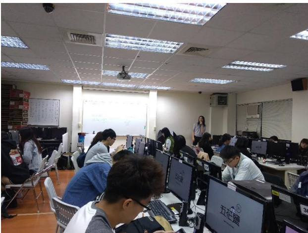
講師介紹五花鹽雜誌

講者分享了很多關於蒐集資料的經驗：「想要獲得最豐富的資料，最好的方法是融入他們」講者說，當你真正融入了他們，你會挖掘出很多你意料之外的事情，這是採訪很難做到的。