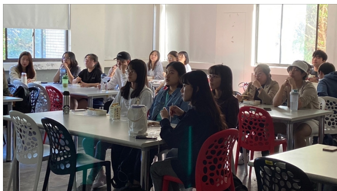
在場與會的學生們專注地聆聽實習經驗分享