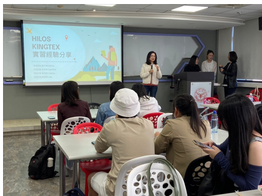
系主任介紹暑期墨西哥實習計畫和分享會講者。